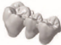
Puente de corona completa