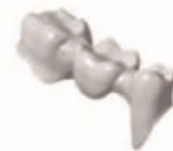
Puente corona interior